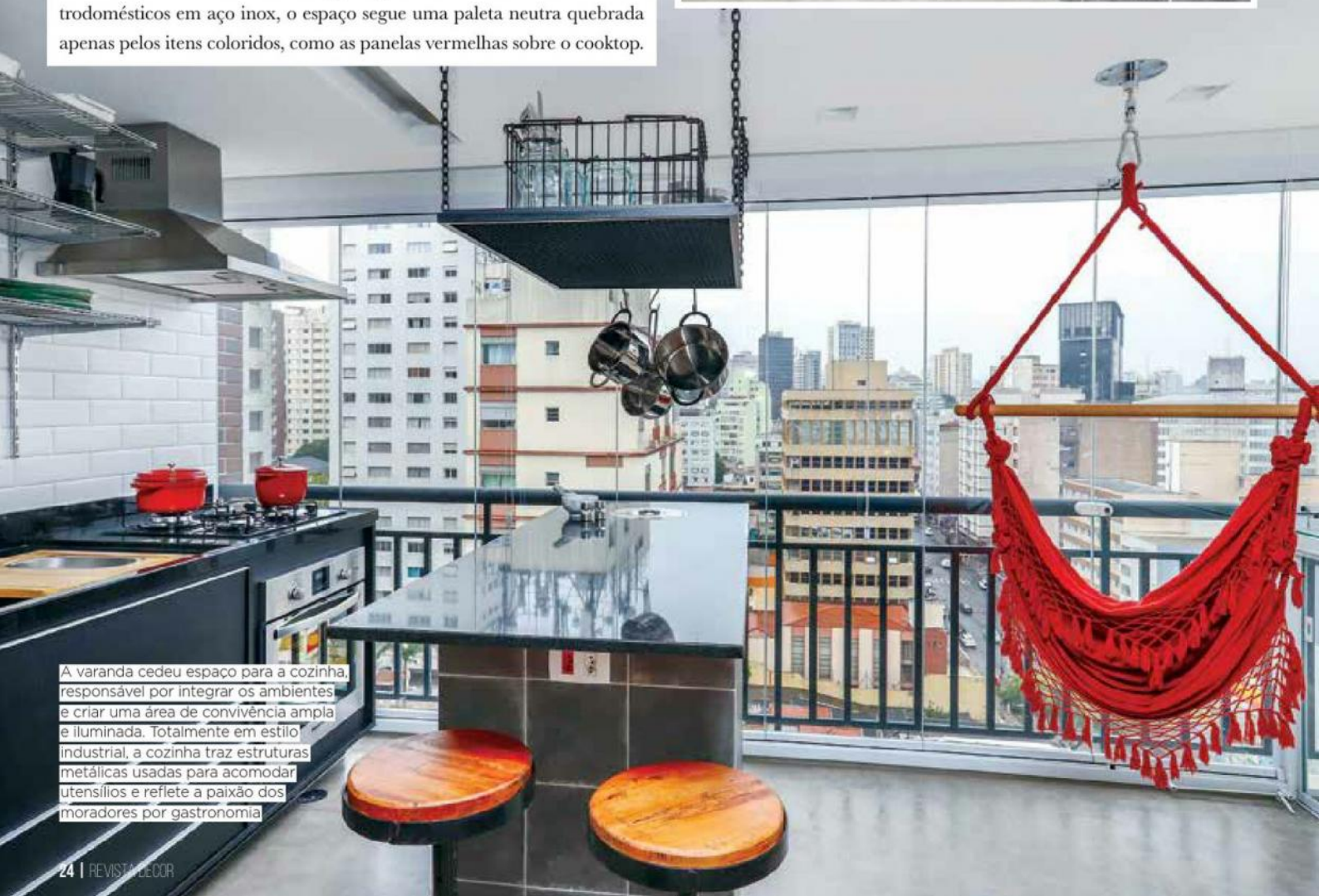
A varanda cedeu espaço para a cozinha, responsável por integrar os ambientes e criar uma área de convivência ampla e iluminada. Totalmente em estilo industrial, a cozinha traz estruturas metálicas usadas para acomodar utensílios e reflete a paixão dos moradores por gastronomia