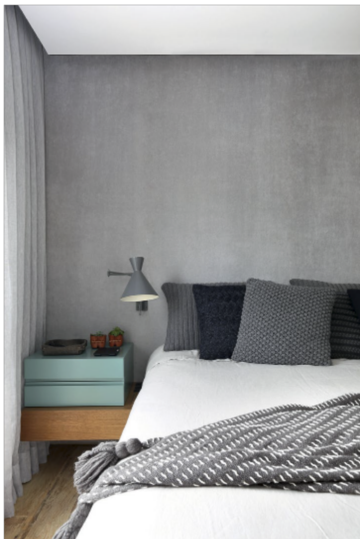
No quarto, almofadas da Codex Home, roupa de cama da Casa Almeida e cortina da Emporium Cortinas compõem o ambiente perfeito para o casal relaxar. Arandela da Bertolucci e cestinho de feltro de Rahyja Afrange (sobre o criado-mudo).