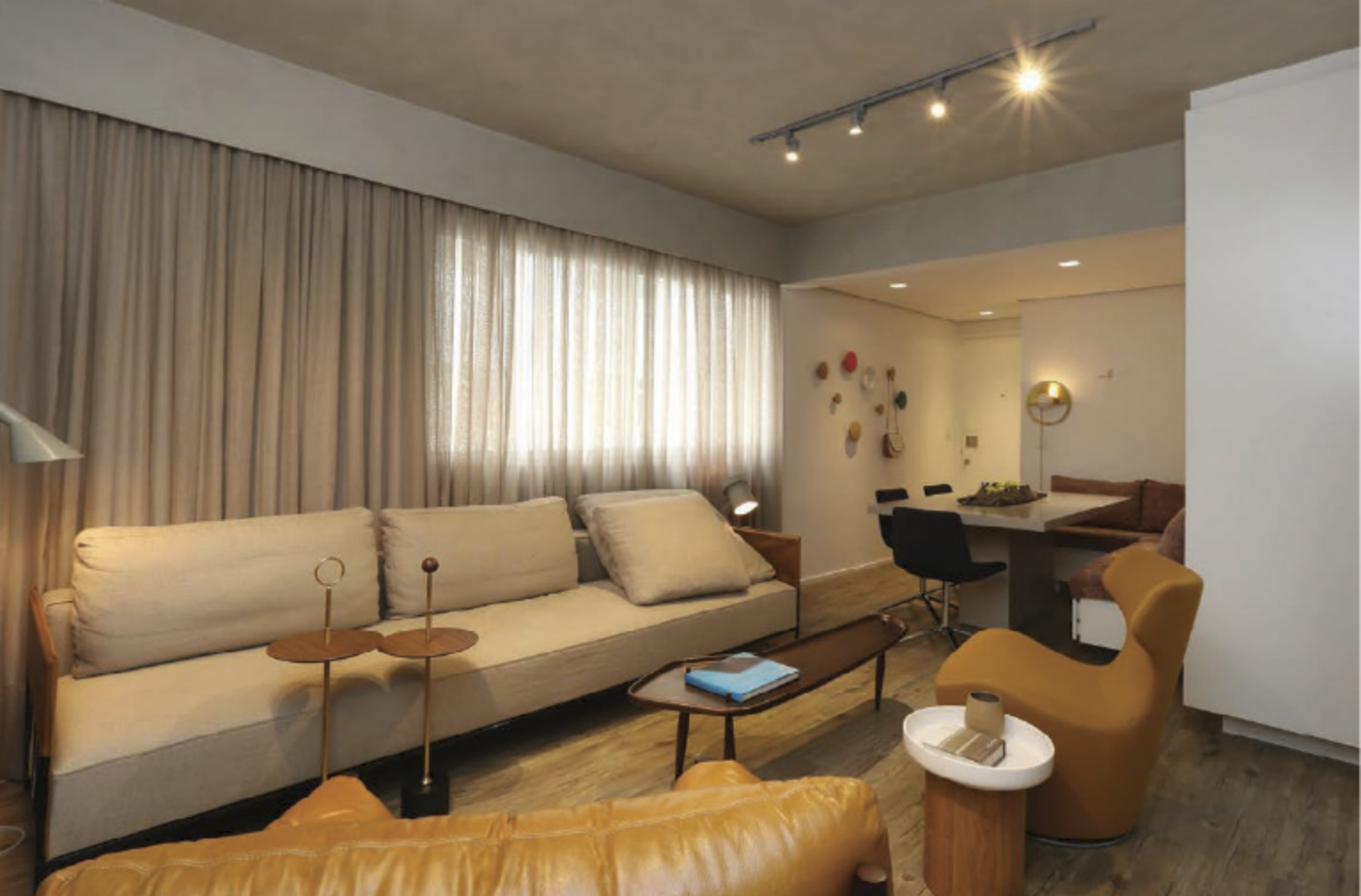
Banco fixo em L com gavetas na base, estofado com tecido de edição limitada desenhado por Patrícia Urquiola, mesa com pintura tipo tecnocimento e cadeiras B&B Itália. Nas paredes, há Dots da Muuto, peças de latão da Bianca Barbato e moldura de acrílico com desenhos de Zanini de Zanini

O casal desfruta de ambientes integrados, arejados e iluminados para receber os amigos