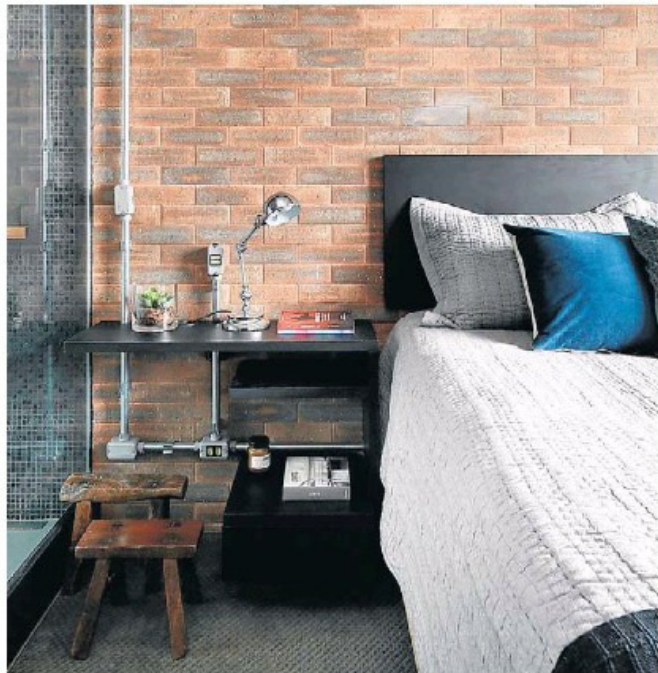
Condutas aparentes compõem a decoração do quarto