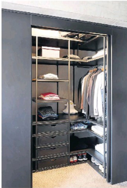
▶ O closet com armários planejados pela arquiteta e painéis de perfis metálicos.