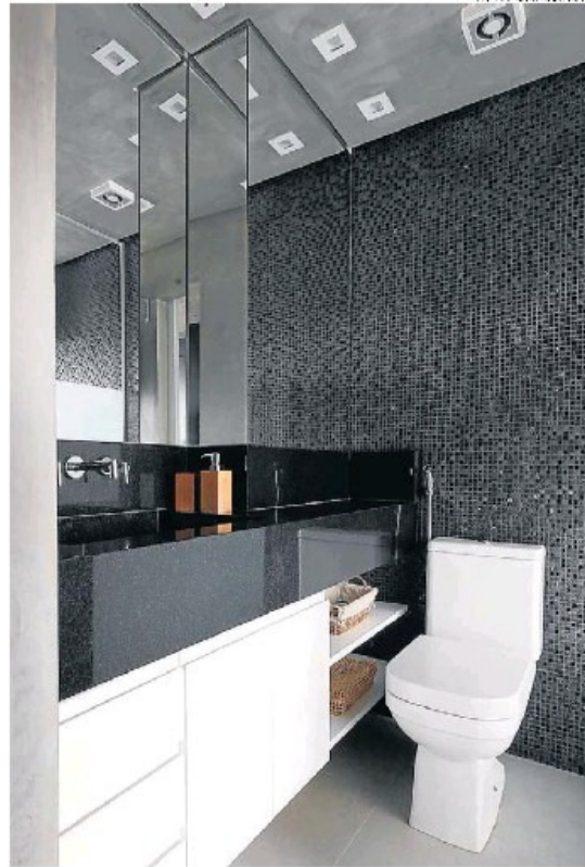
▶ O banheiro com o pavimento inferior, também em tonalidades escuras.

jeito, ainda mais que os materiais empregados eram comparáveis com o orçamento estipulado pelo meu cliente. Mas, ainda assim, optei por uma abordagem mais suave”, assume Marina, que, para evitar excessos, procurou inserir nos ambientes materiais mais suaves e agradáveis ao toque, como o couro e a lã.