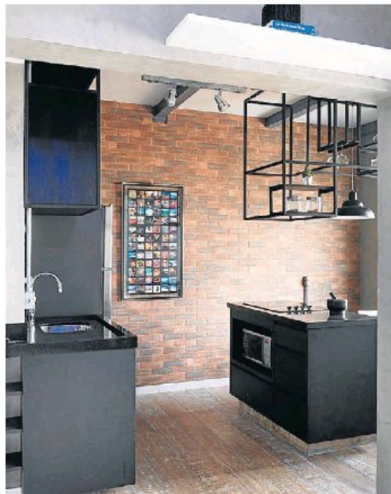
➤ A área da cozinha e do lado, metálica, com a estrutura do moçoim no aparente.