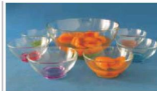
FOTO ILLUSTRATIVA 2 litros de 158,00 por RS 99,00 4 litros de 230,00 por RS 139,00