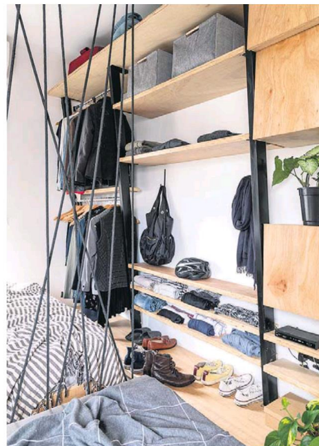
✓ Painel com cordas separa a sala de estar do quarto