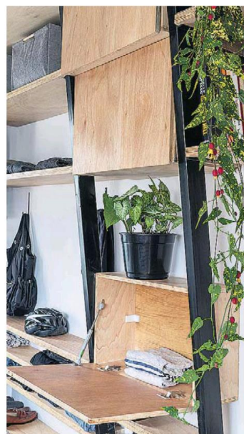
✓ Para reduzir o orçamento, gavetas têm fechamento por toque