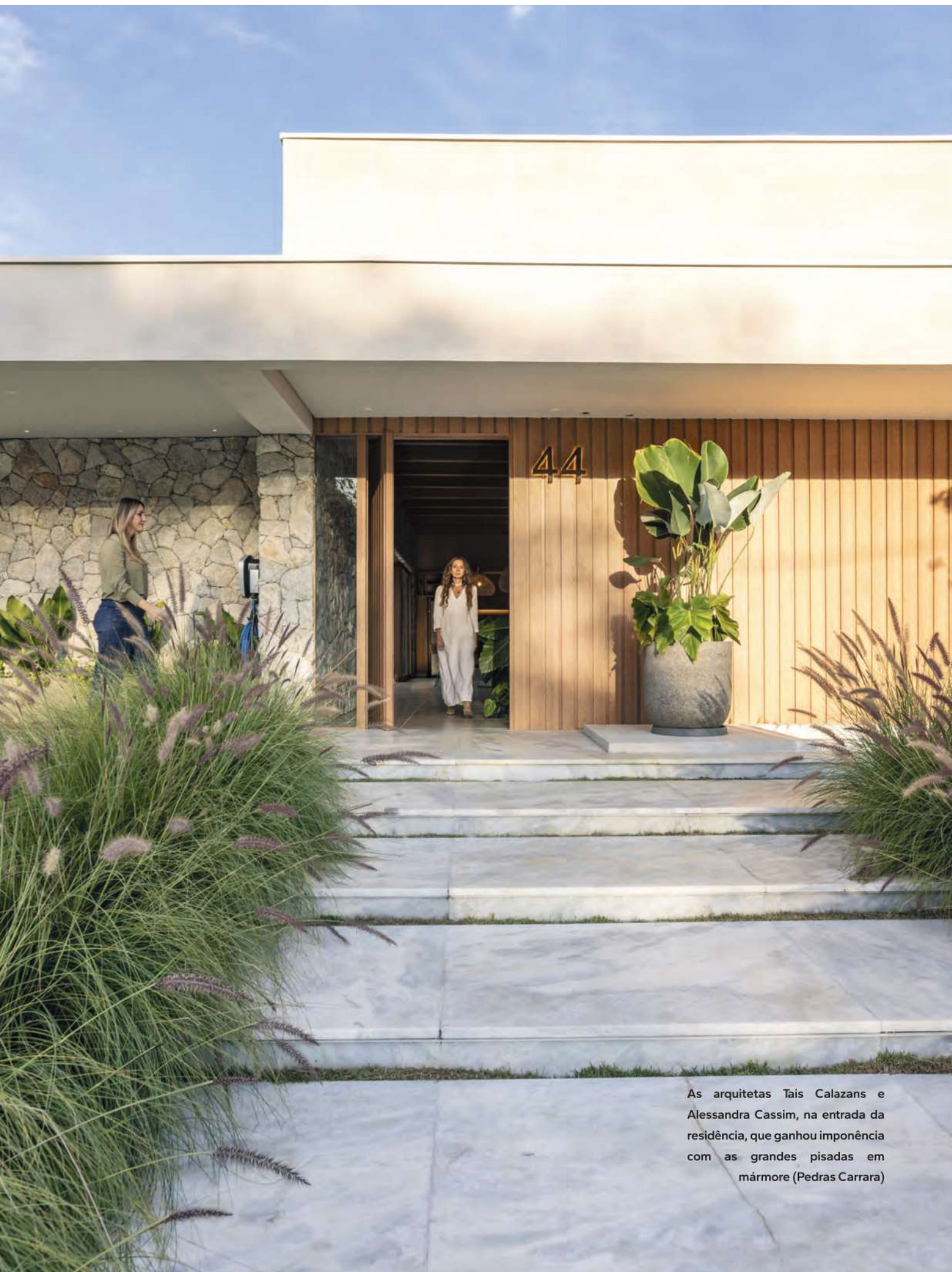
As arquitetas Tais Calazans e Alessandra Cassim, na entrada da residência, que ganhou imponência com as grandes pisadas em mármore (Pedras Carrara)